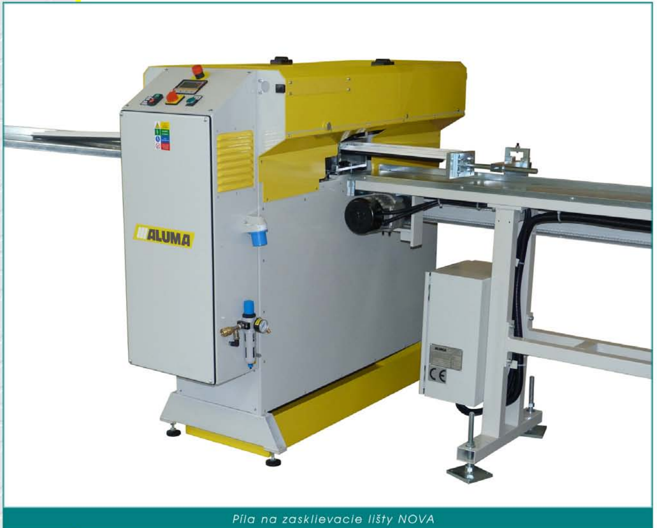
Píla na zasklievacie lišty NOVA