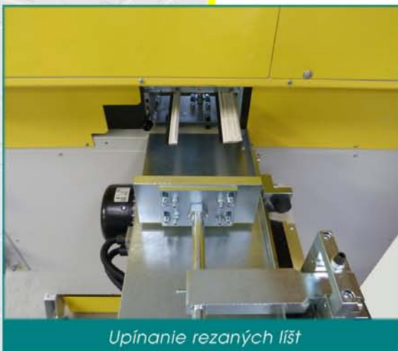
Upínanie rezaných líšt