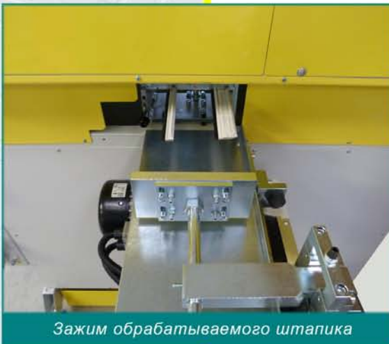
Зажим обрабатываемого штапика