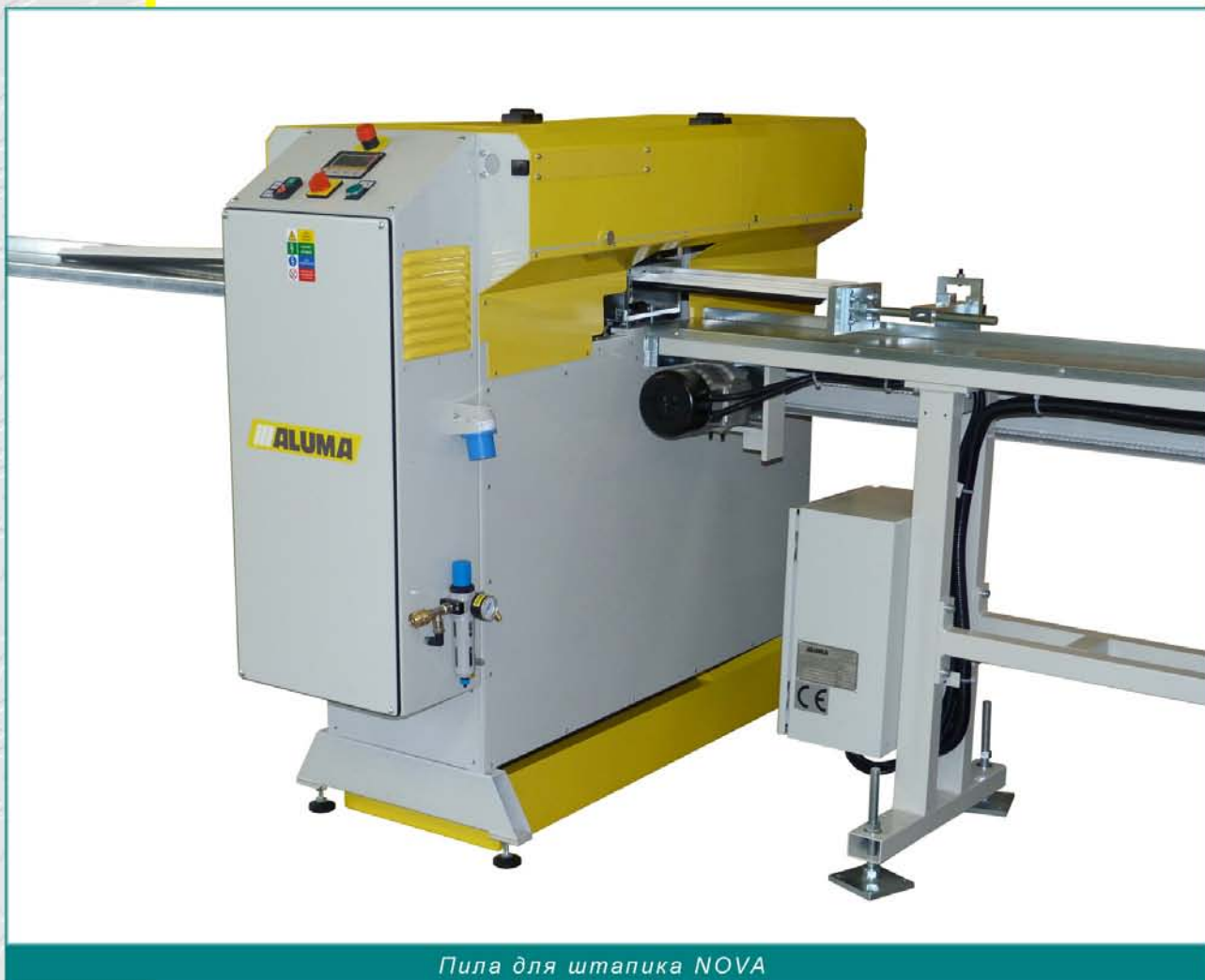
Пила для штапика NOVA