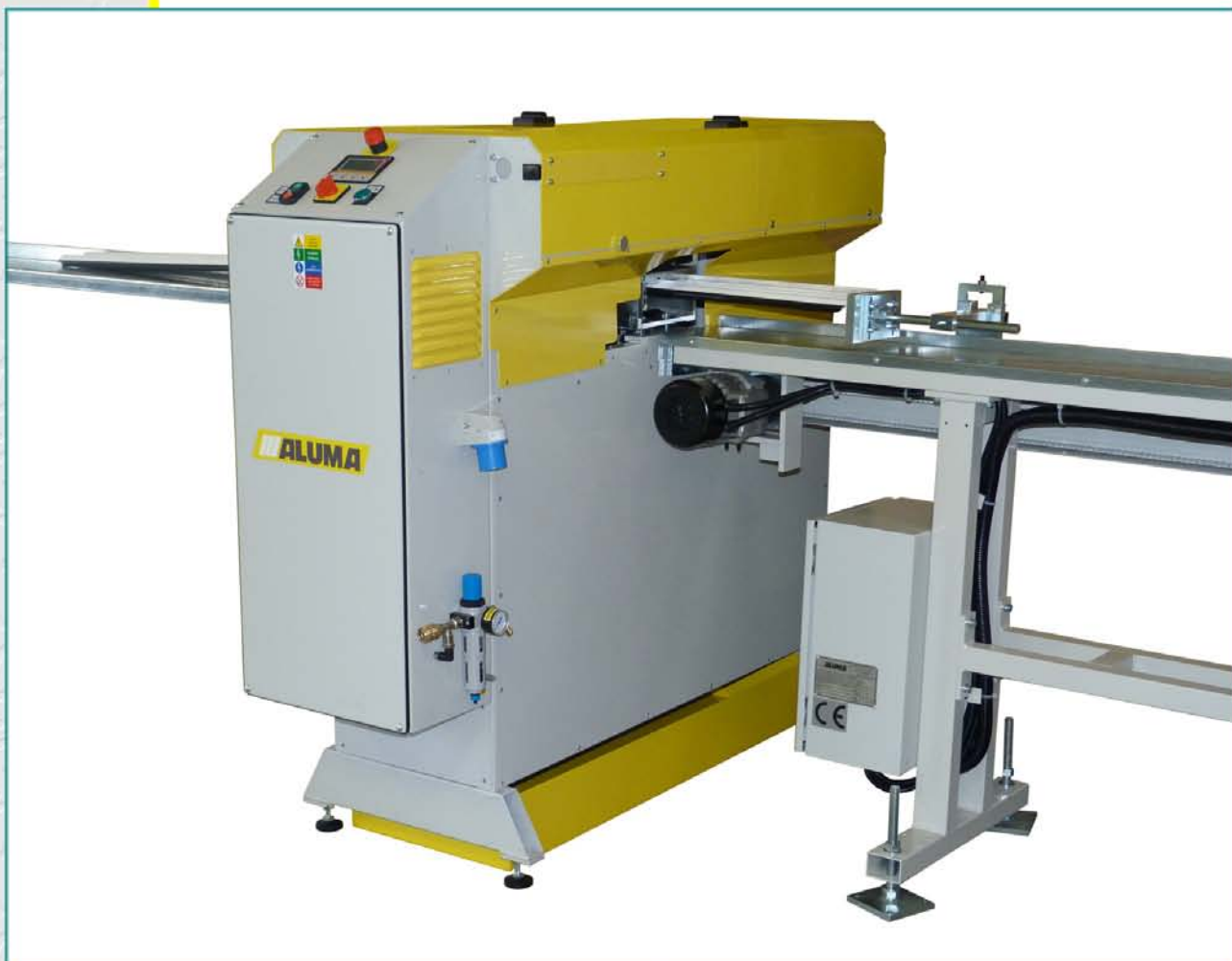
Mašina za sečenje lajsni za zastakljivanje NOVA