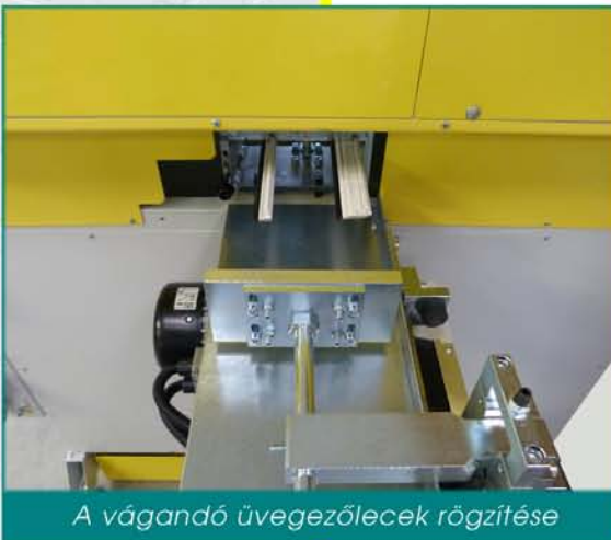
A vágandó üvegezőlecek rögzítése