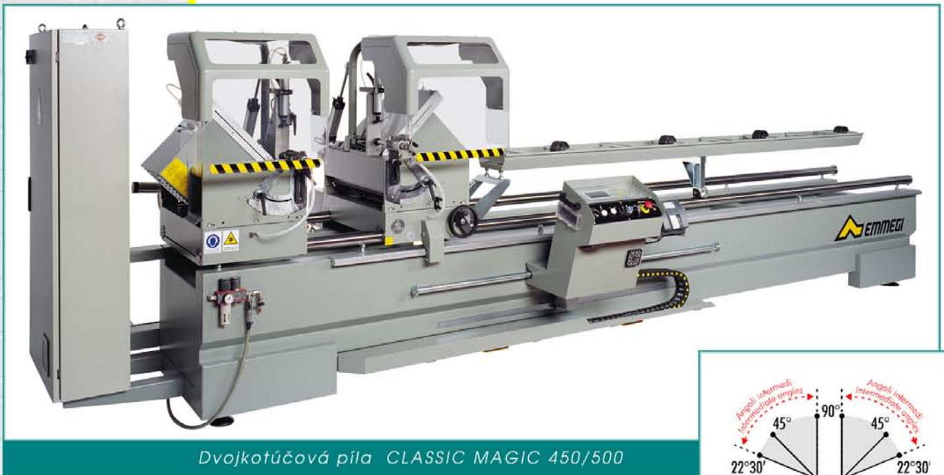
Dvojkotúčová píla CLASSIC MAGIC 450/500