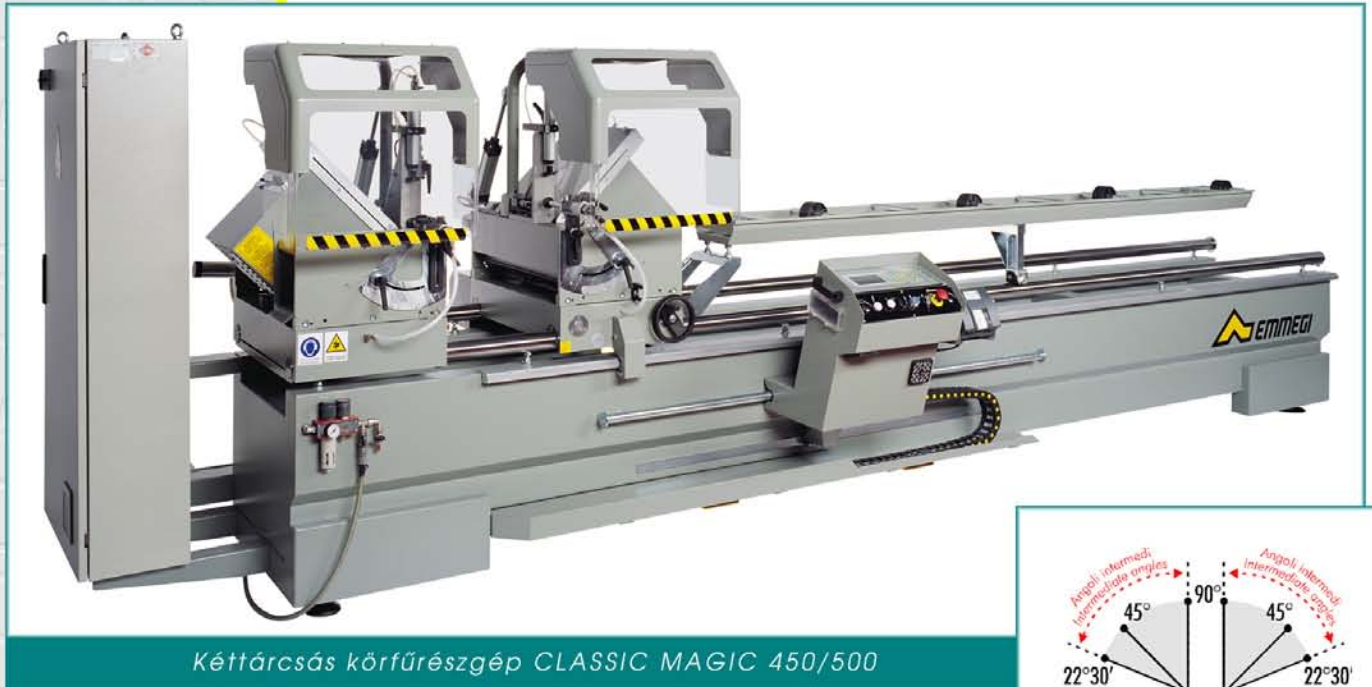
Kéttárcsás körfűrészgép CLASSIC MAGIC 450/500