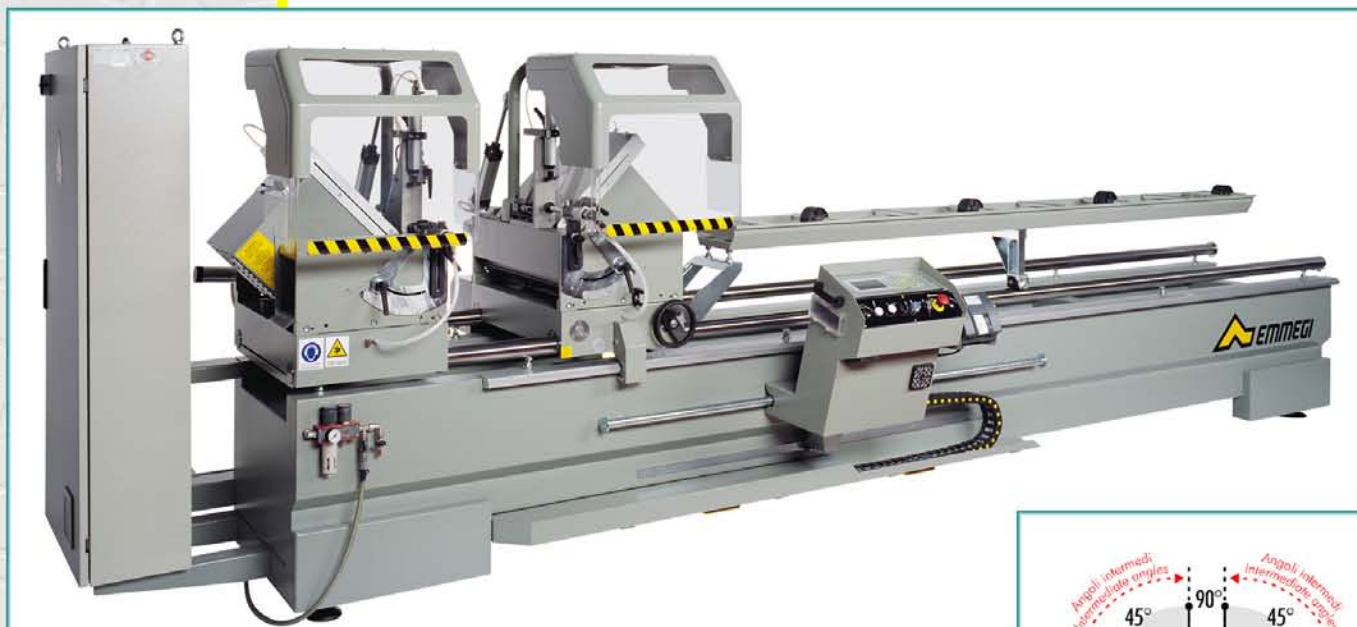
Dvoukotoučová pila CLASSIC MAGIC 450/500