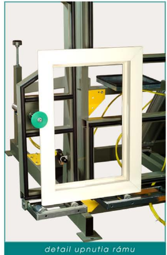
detail upnutia rámu