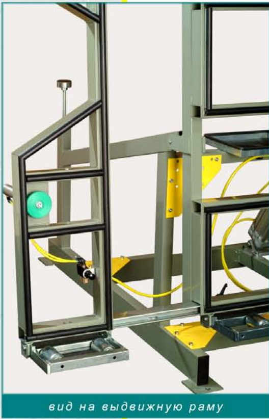
вид на выдвижную раму