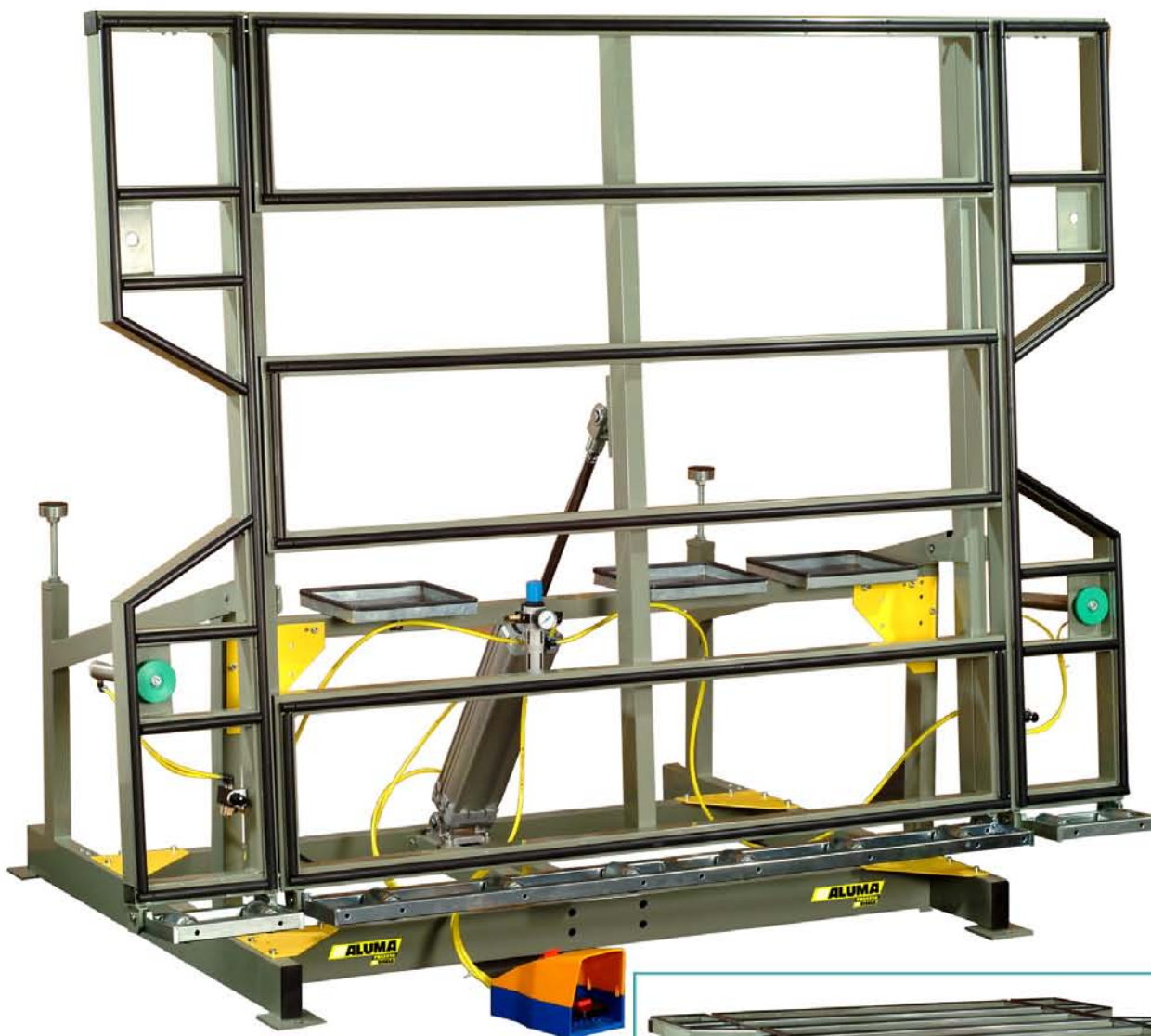
Okretno montažni sto ELAN – tip TFM-P-172209