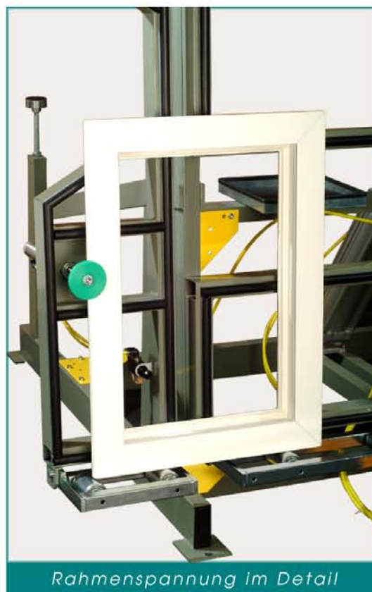
Rahmenspannung im Detail