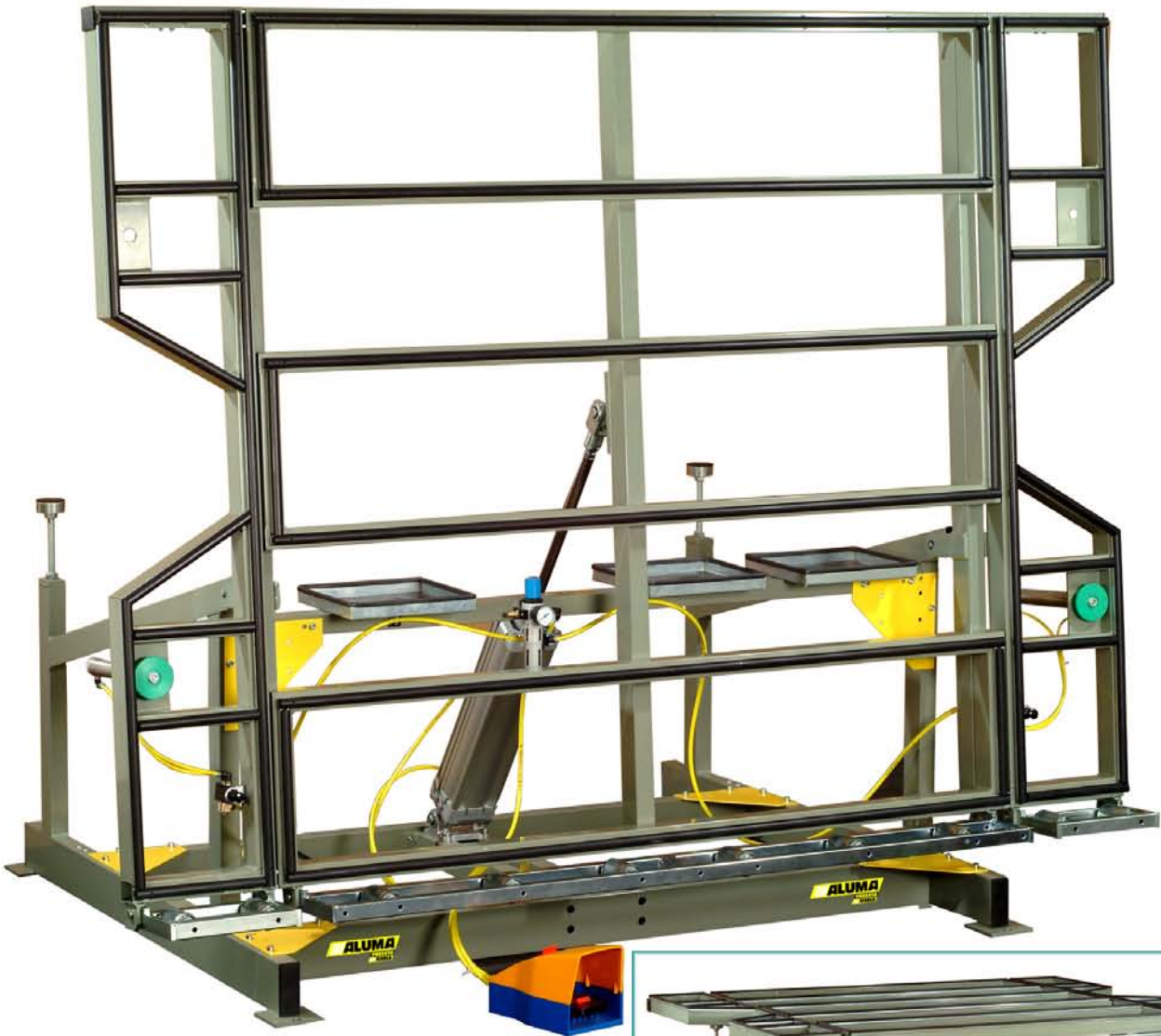
Kipptisch ELAN – Modell TFM-P-172209