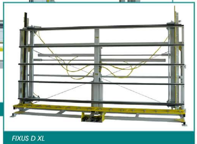
FIXUS D XL