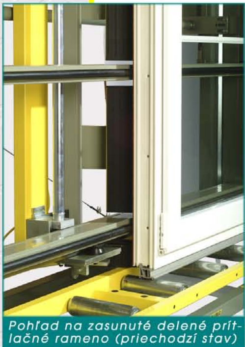
Pohľad na zasunuté delené prítláčné rameno (priechodzí stav)