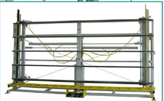
FIXUS D XL