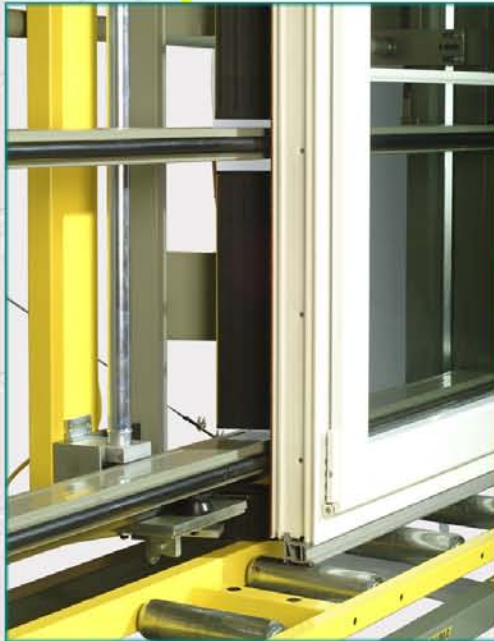
Pogled na obavezno odvojivi klizni deo