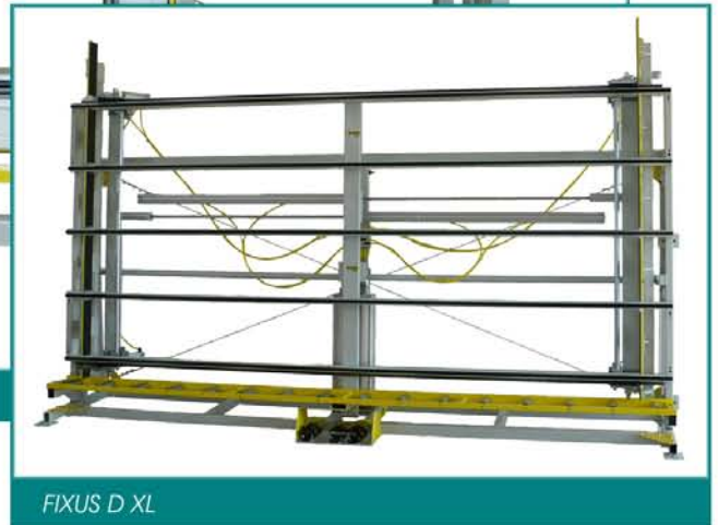
FIXUS D XL