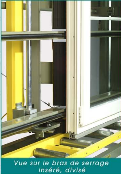
Vue sur le bras de serrage inséré, divisé