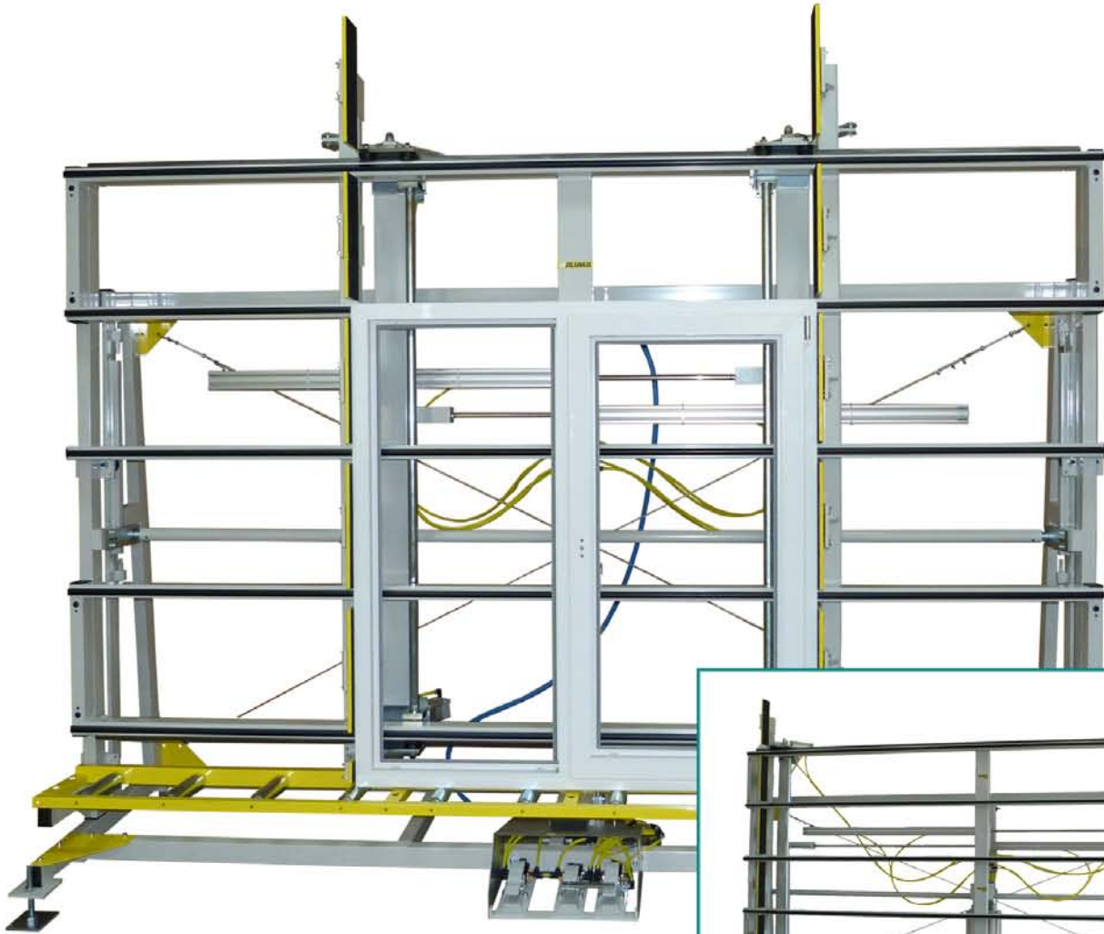
Kontroll- und Verglasungseinheit FIXUS D