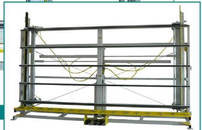
FIXUS D XL