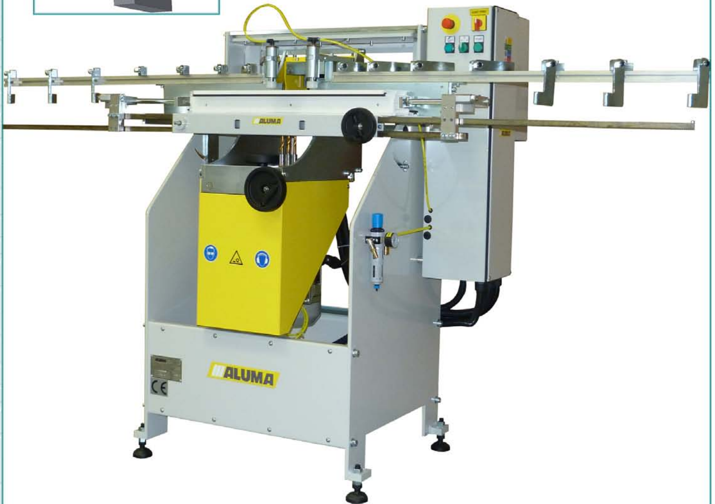
Automat za glodanje i bušenje otvora u materijalu PANTOMAT