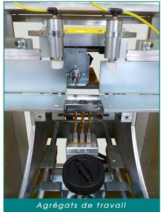
Agréats de travail