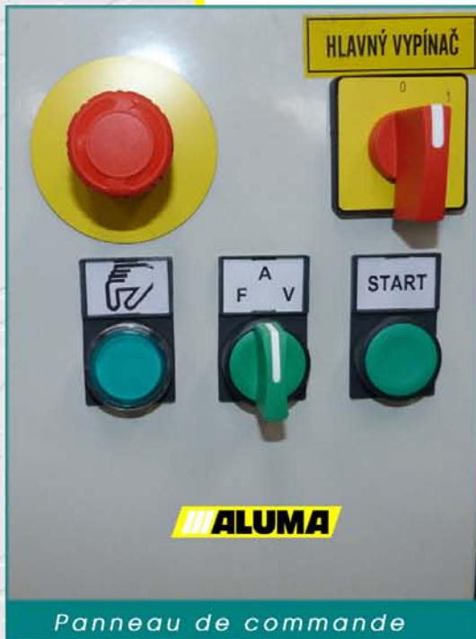
Panneau de commande