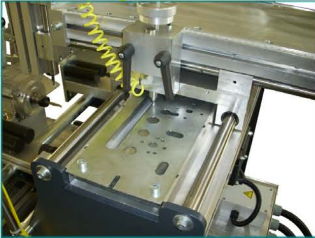
Шаблон с гротом