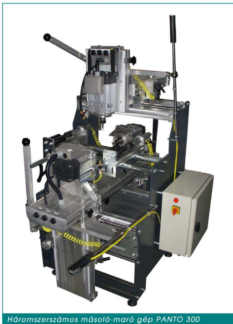
Háromszerszámos másoló-maró gép PANTO 300