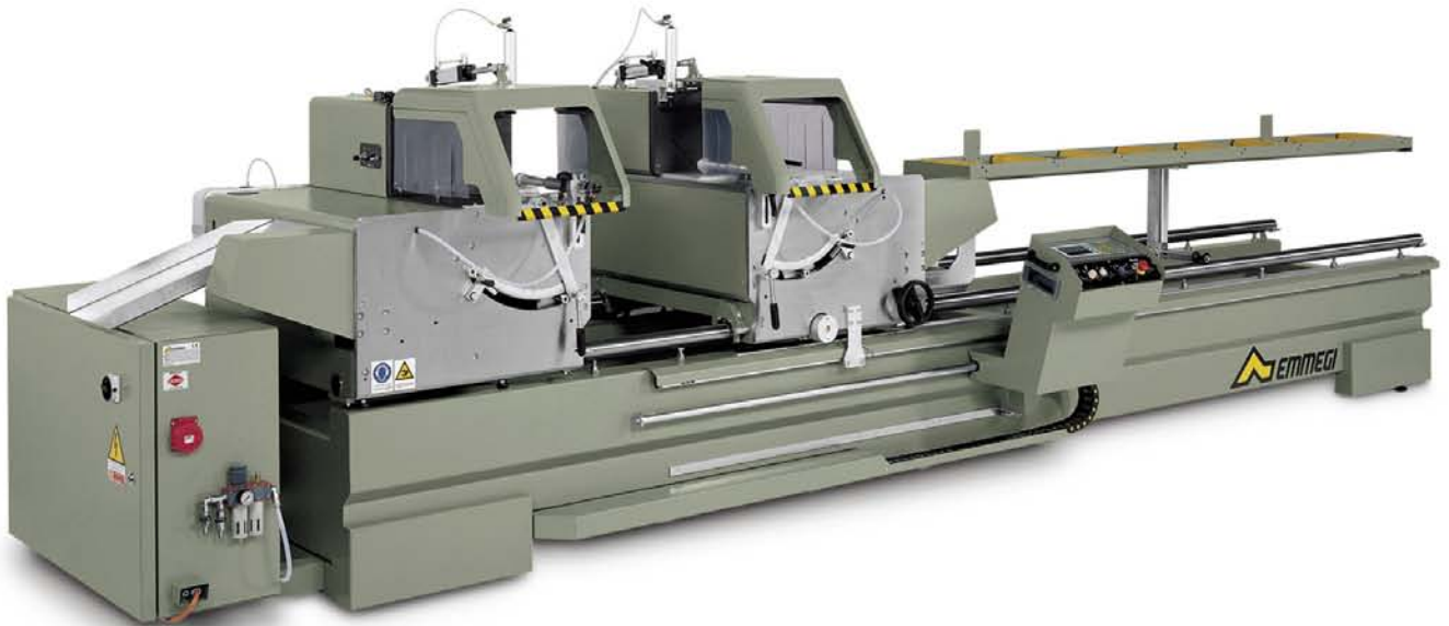
Vysokovýkonná dvojkotúčová píla RADIAL