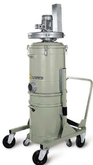
Odsávacie zariadenie MG 4