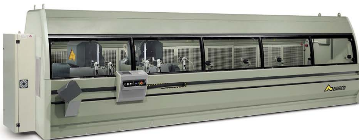
Dvojkotúčová píla v kabíne ISOLA