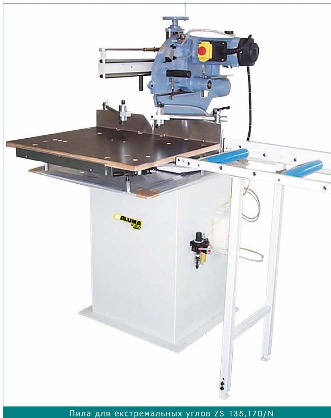
Пила для экстремальных углов ZS 135,170/N