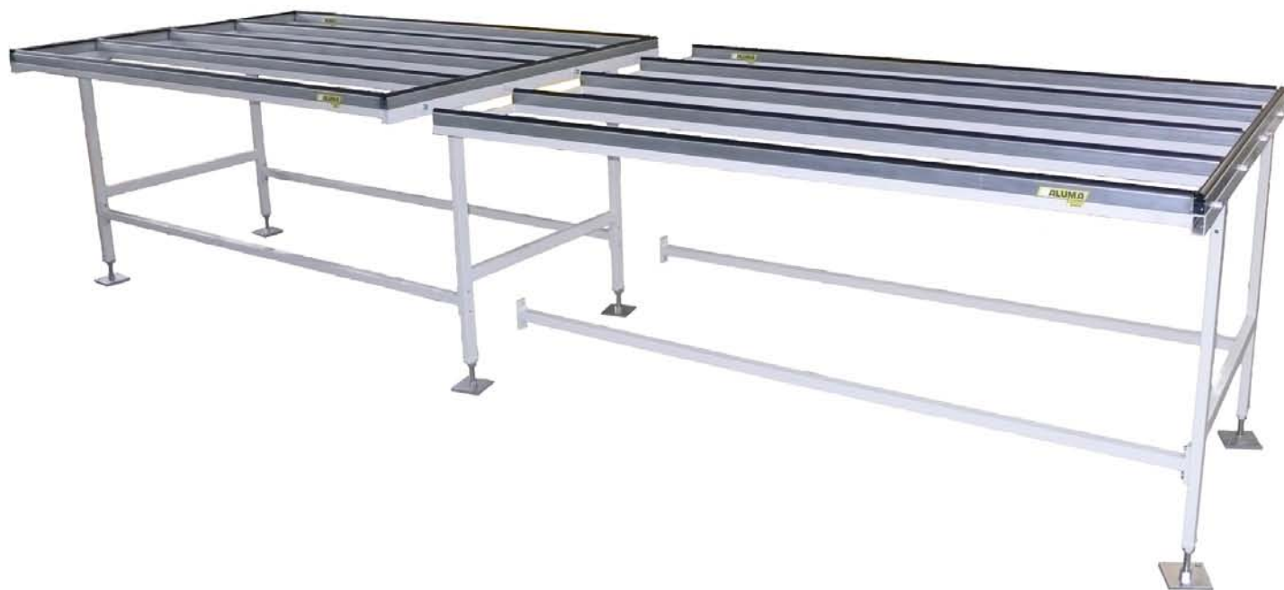
Montažni sto (osnovni + produženi model)