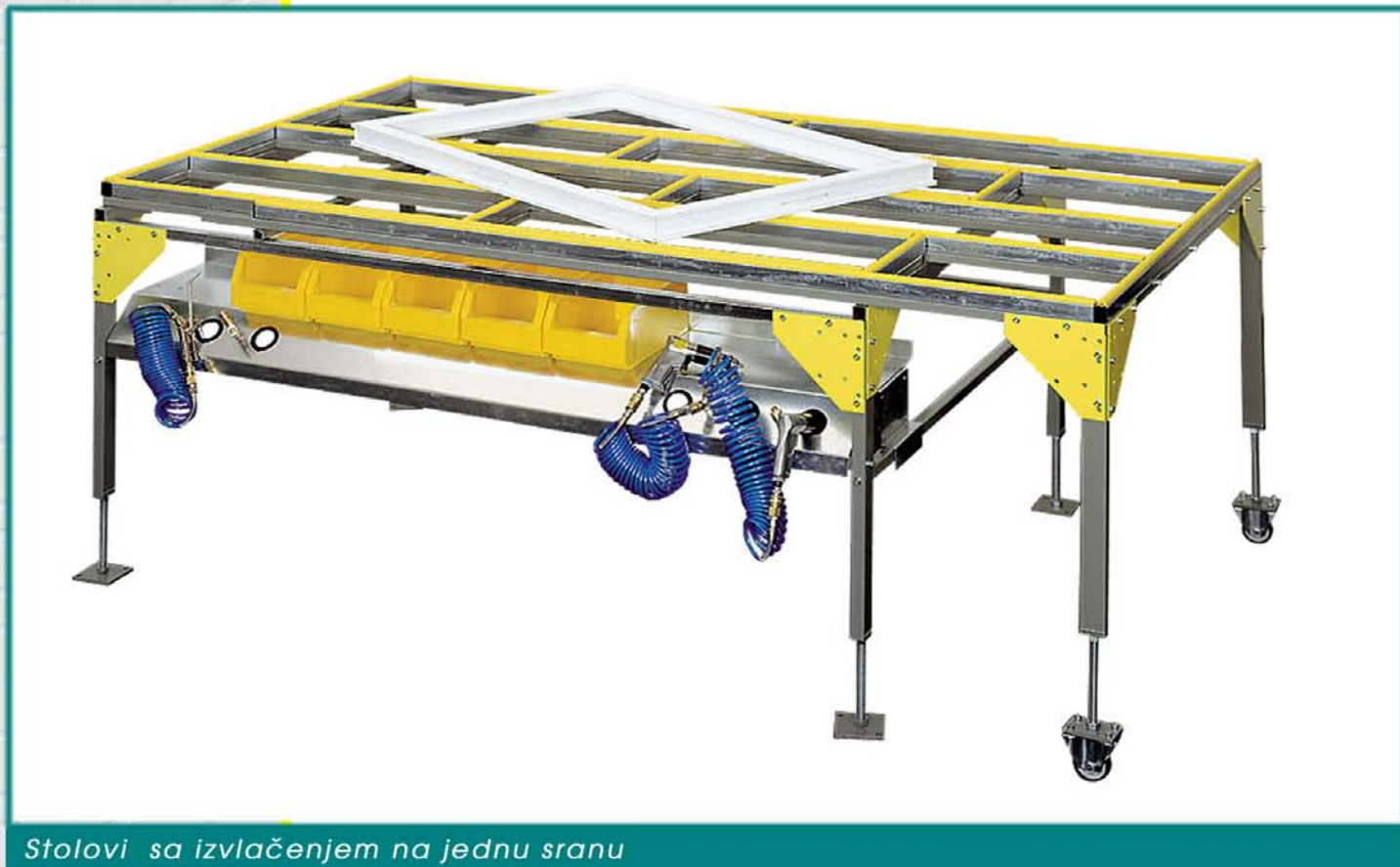
Stolovi sa izvlačenjem na jednu stranu