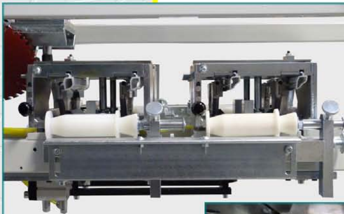
Upínanie rezaných lišt