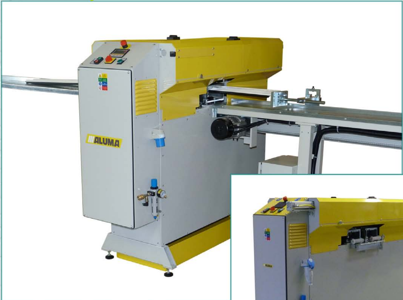
Píla na zasklievacie lišty NOVA