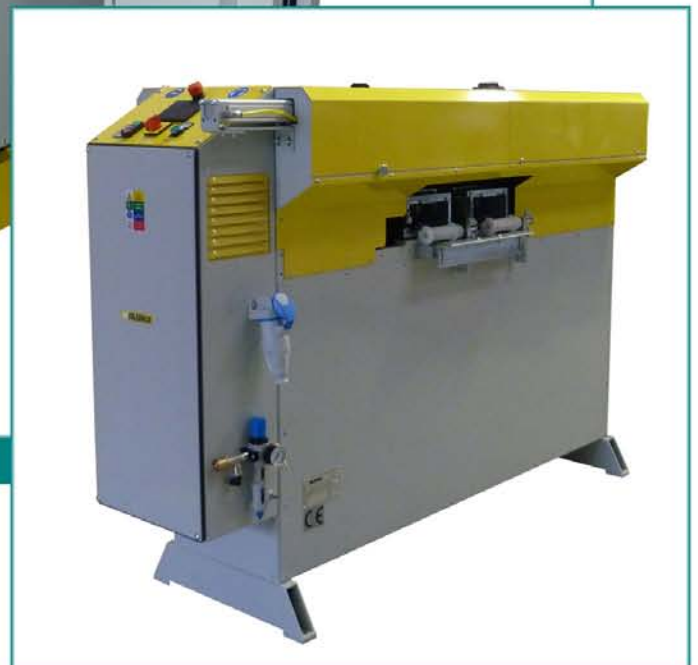
Píla na zasklievacie lišty NOVA DOUBLE