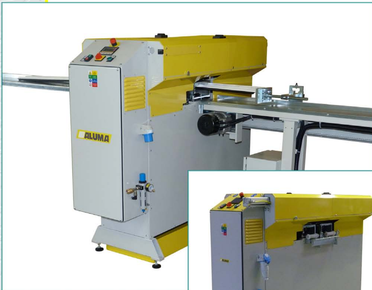
Mašina za sečenje lajsni za zastakljivanje NOVA