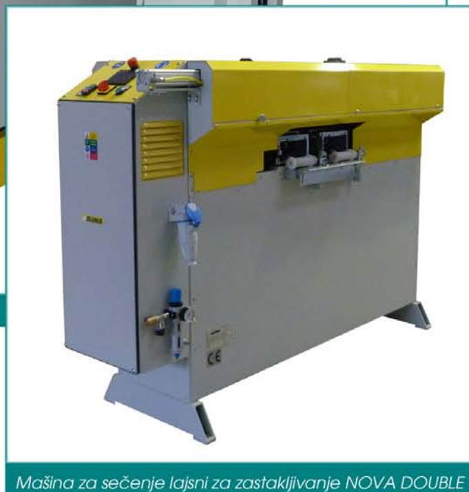
Mašina za sečenje lajsni za zastakljivanje NOVA DOUBLE