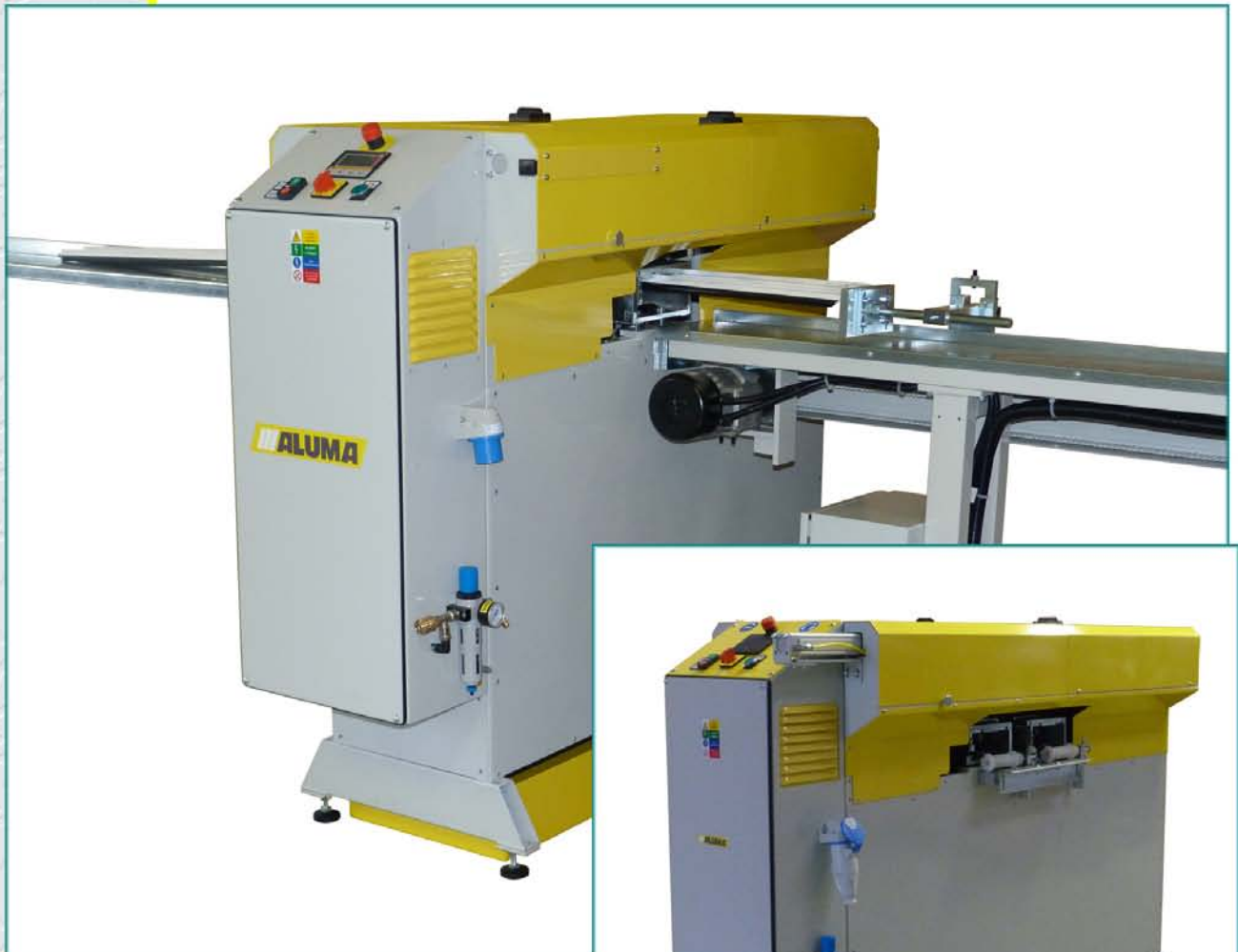
Pila na zasklívací lišty NOVA