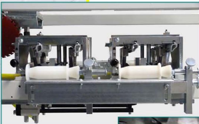
Upínání řezaných lišt