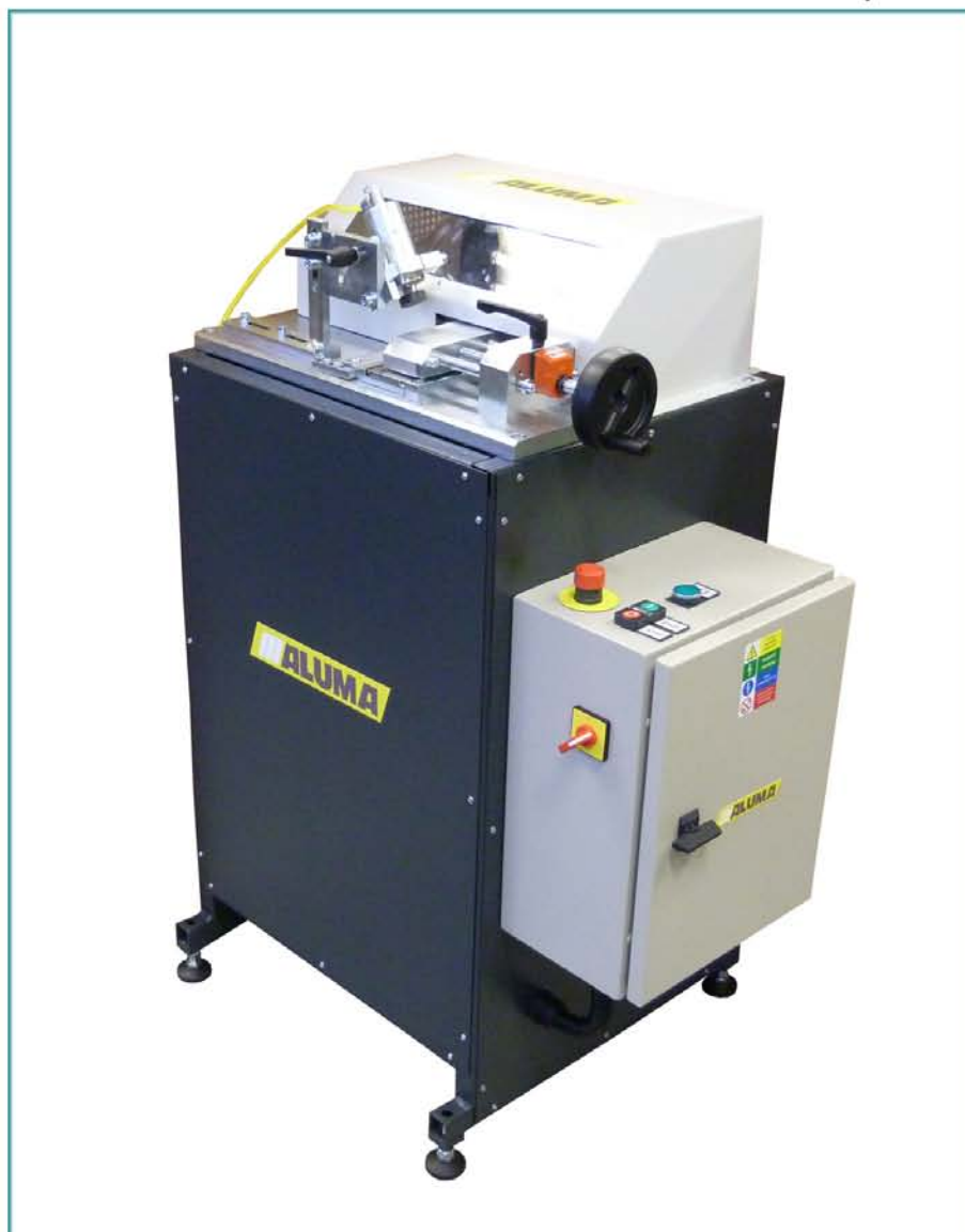
Píla na zasklievacie lišty NOVA FINAL