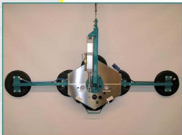
Detail pre prácu vo vertikálnej a horizontálnej polohe