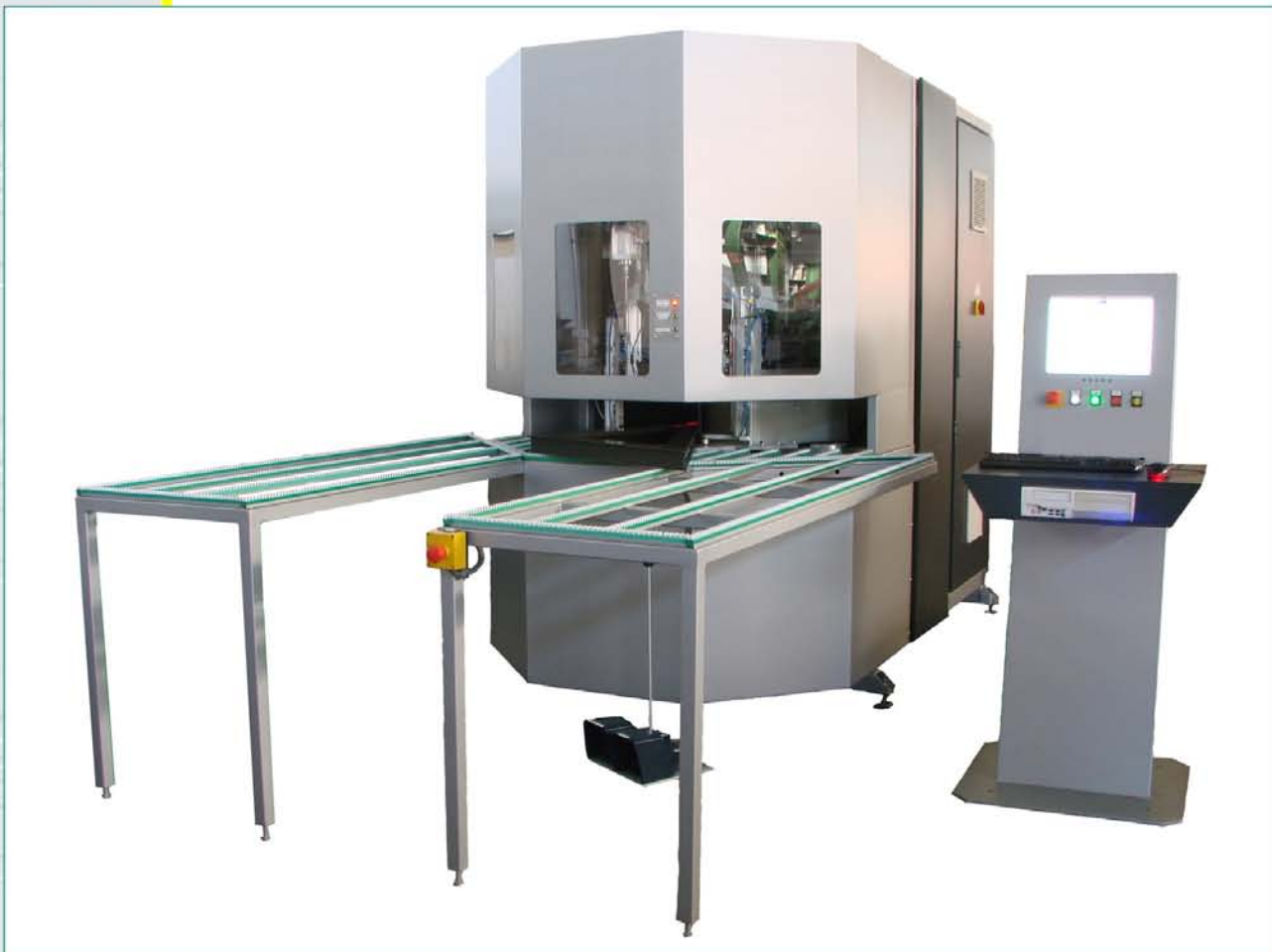
CNC зачистной автомат APH-1LV