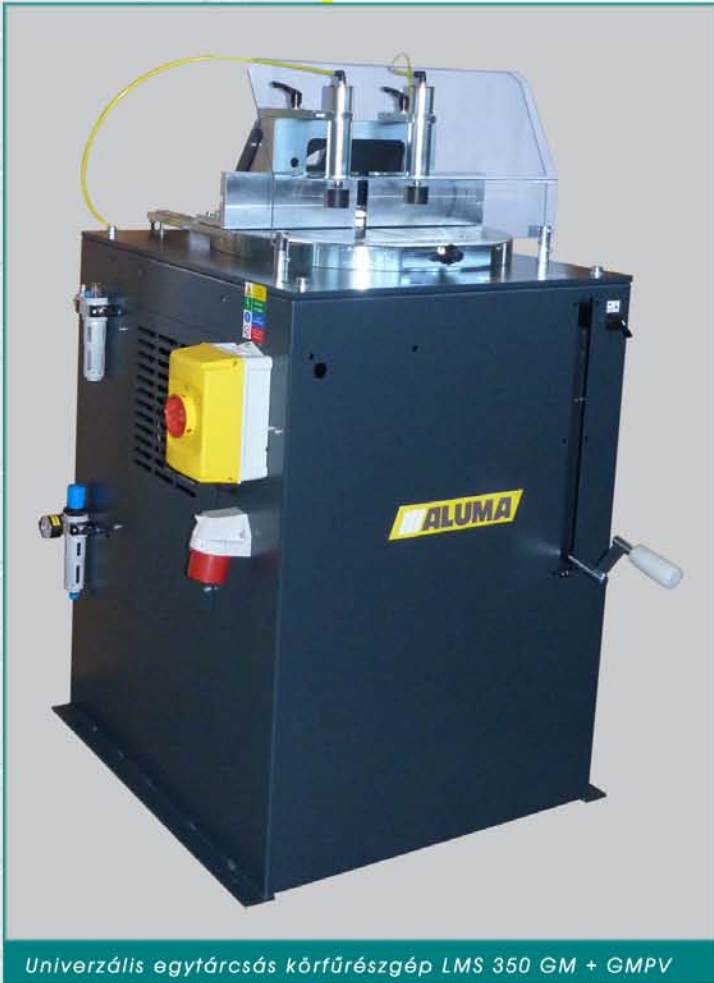
Univerzális egytárcsás körfűrészgép LMS 350 GM + GMPV