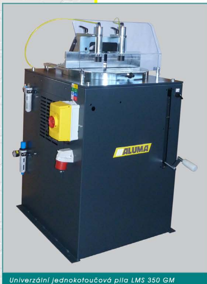
Univerzální jednokotoučová pila LMS 350 GM