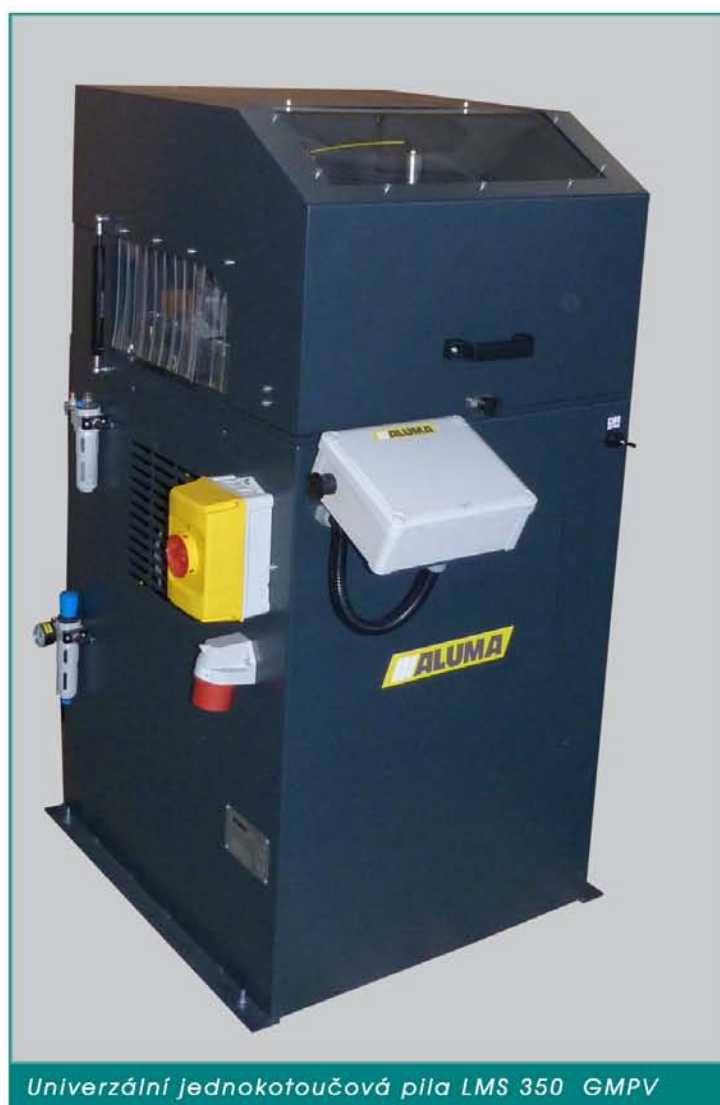
Univerzální jednokotoučová pila LMS 350 GMPV