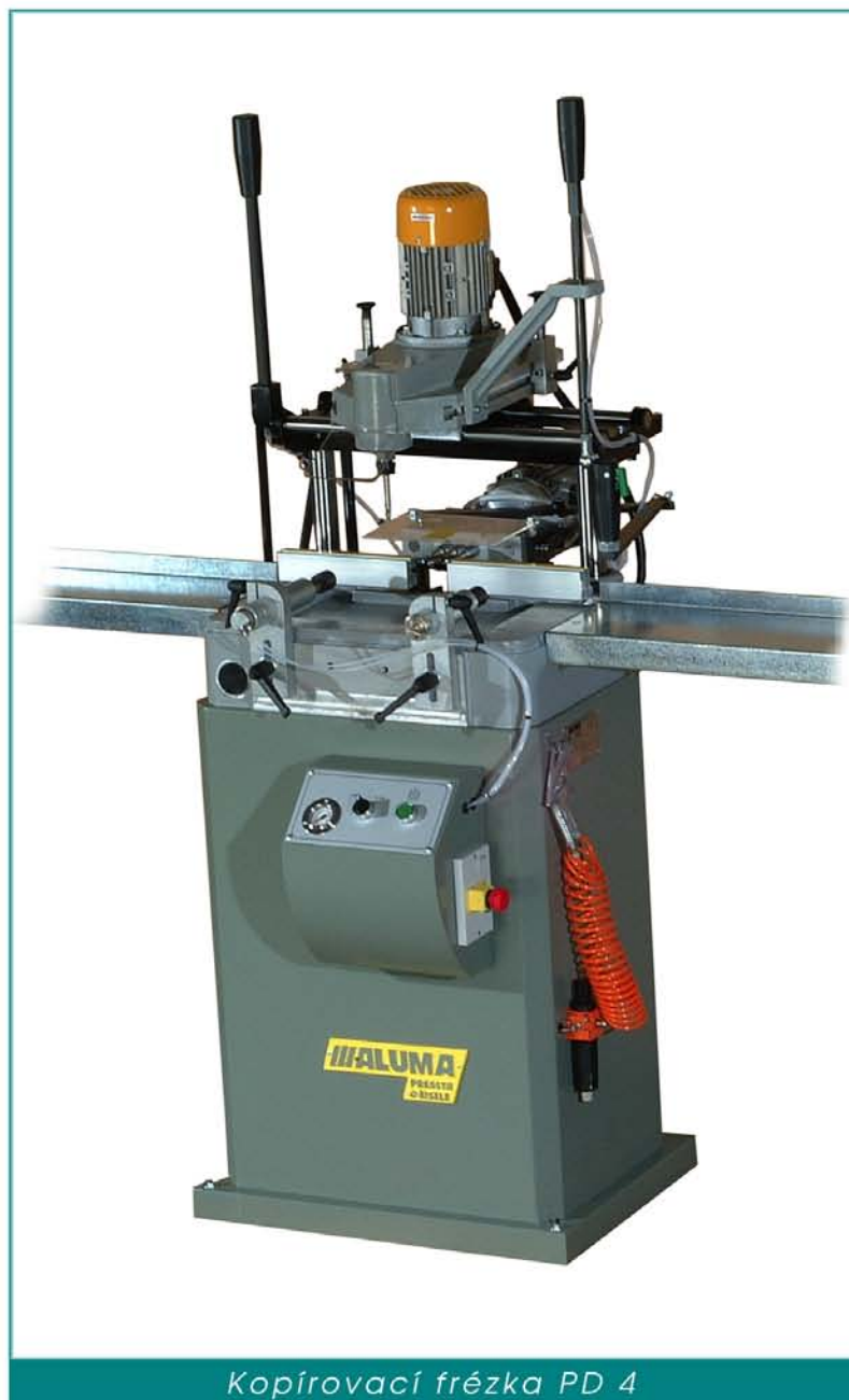
Kopírovací frézka PD 4