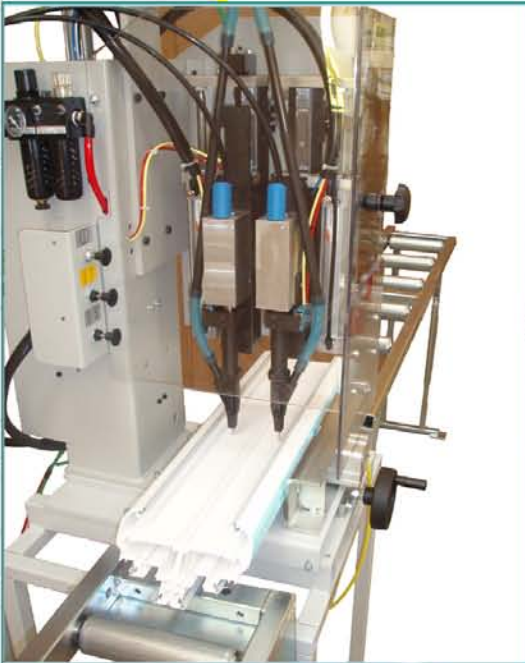
Skrutkovač výstuží ADS DE 1/1