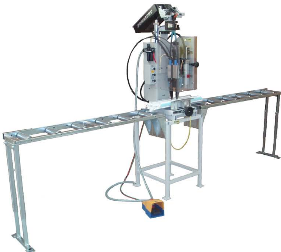
Закрепление армирующего профиля ADS DE 1/1