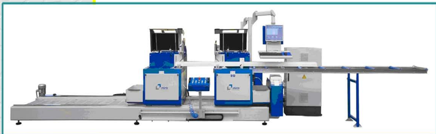
Двухдисковая автоматическая пила DG-SM-XX