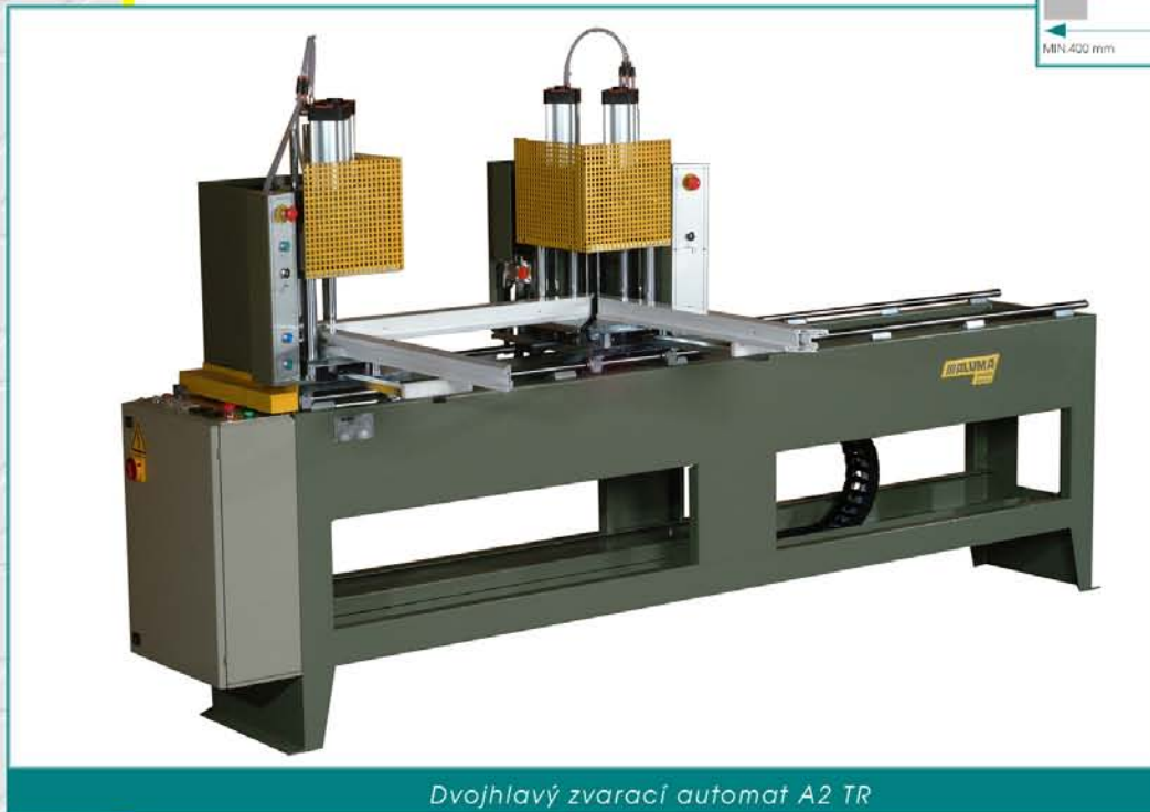
Dvojhlavý zvarací automat A2 TR