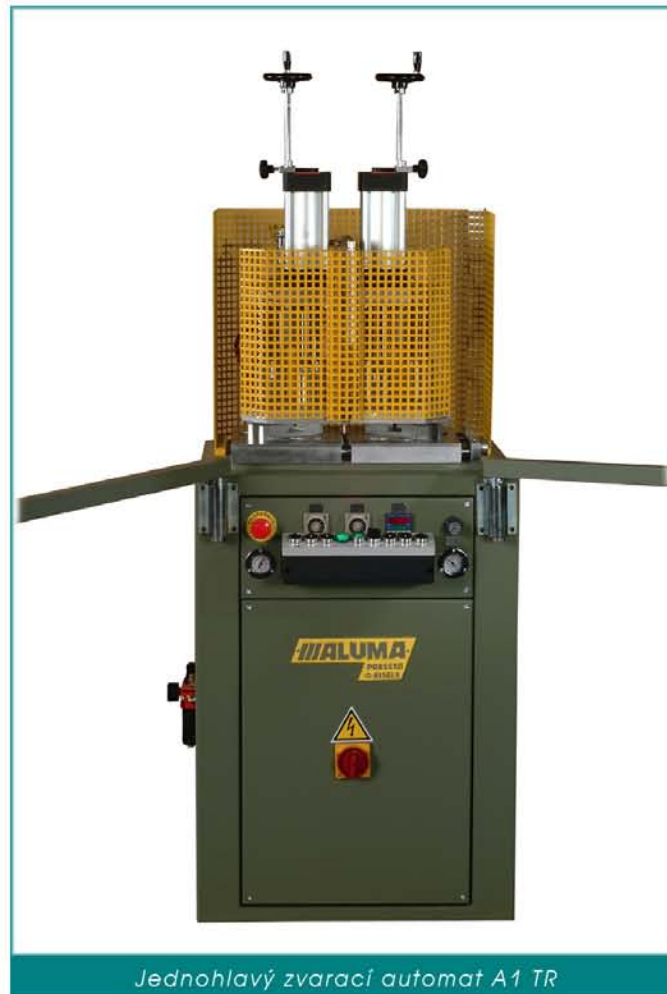
Jednohlavý zvarací automat A1 TR