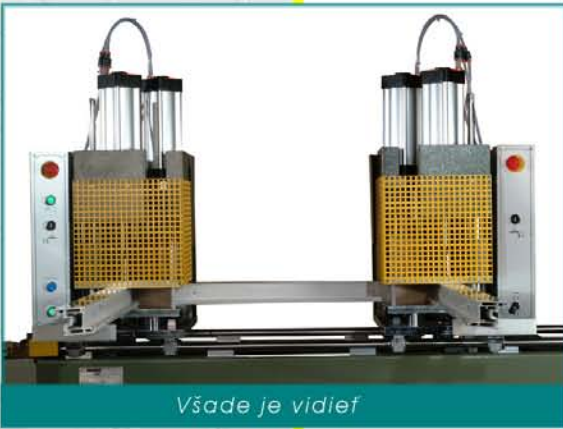
Všade je vidieť