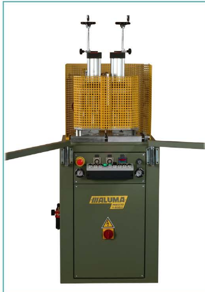
Одноголовый сварочный автомат A1 TR