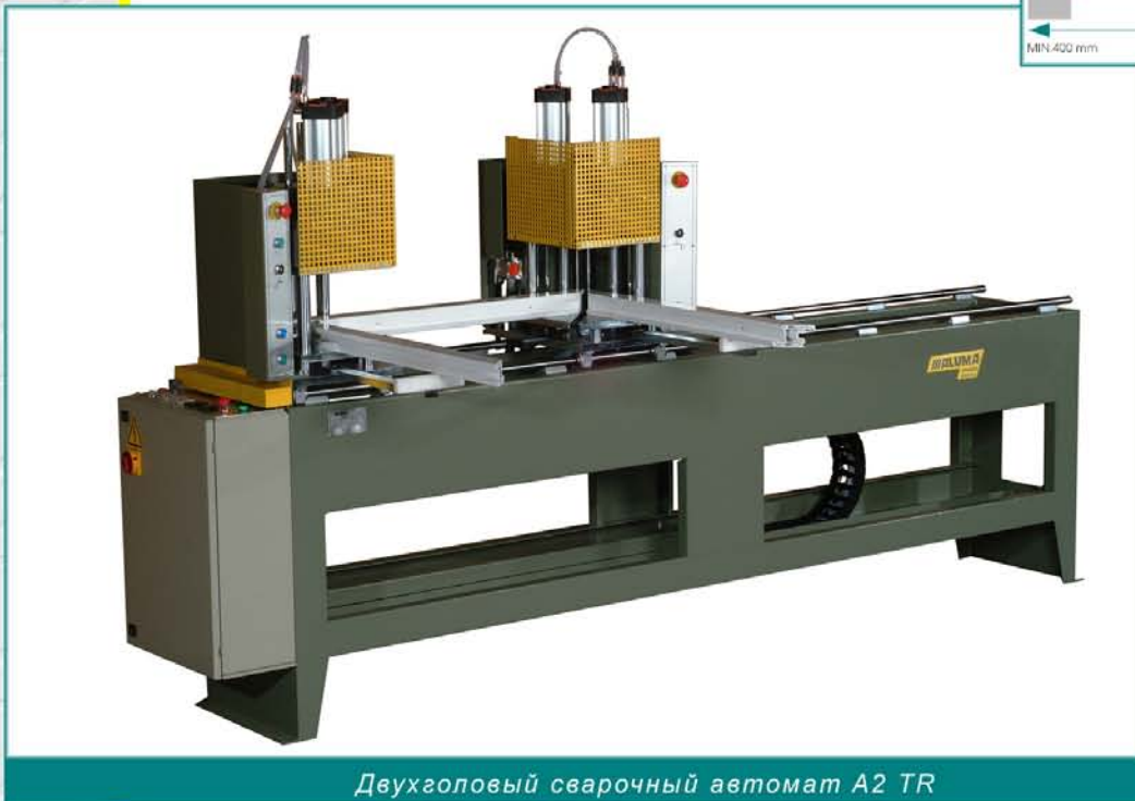
Двухголовый сварочный автомат A2 TR