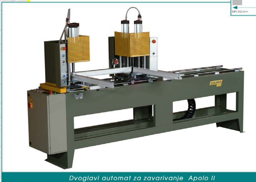
Dvoglavi automat za zavarivanje Apollo II