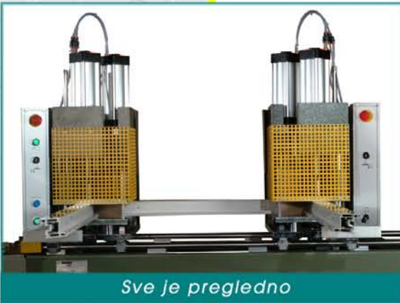
Sve je pregledno