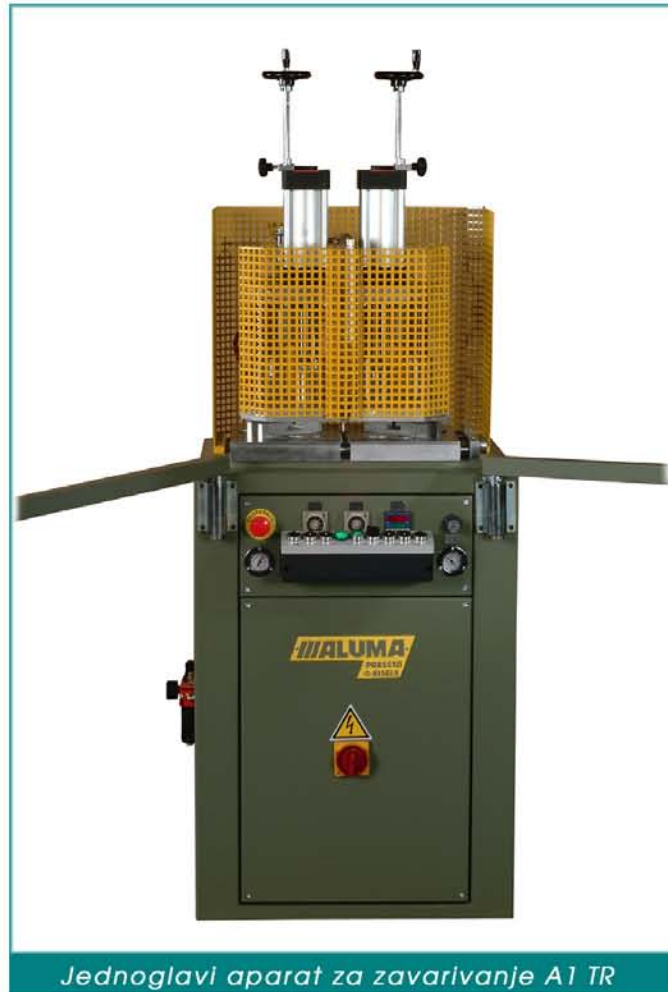
Jednoglavi aparat za zavarivanje A1 TR