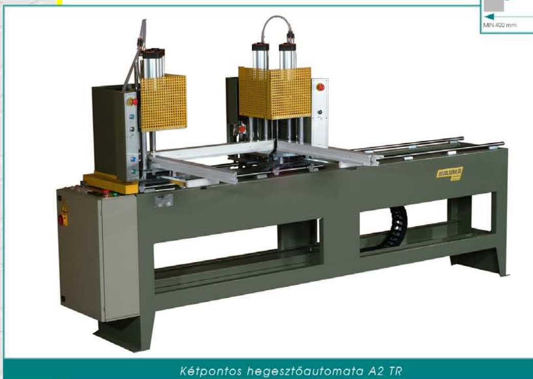
Kétpontos hegesztőautomata A2 TR