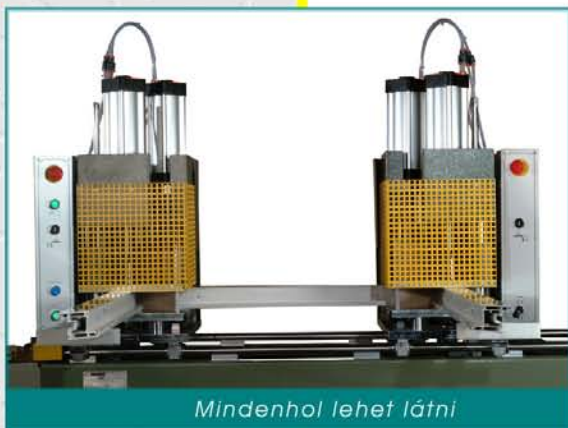
Mindenhol lehet látni