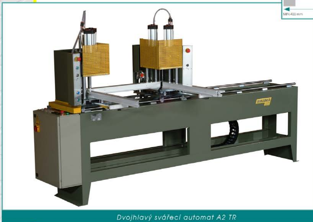
Dvojhlavý svařecí automat A2 TR