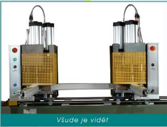
Všude je vidět