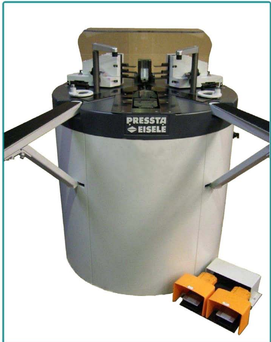
PRESSTA 7000 - Станок для запрессовки углов