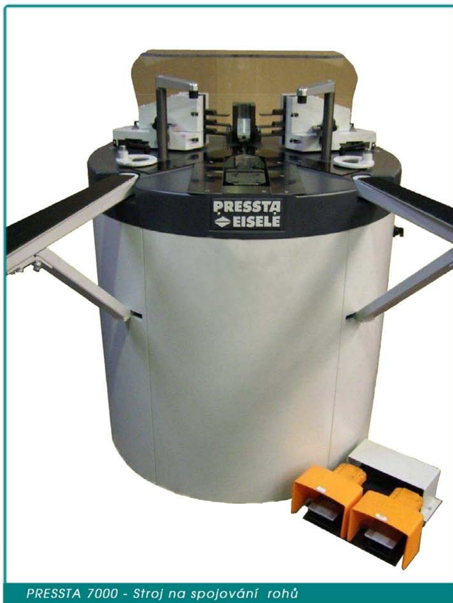
PRESSTA 7000 - Stroj na spojování rohů