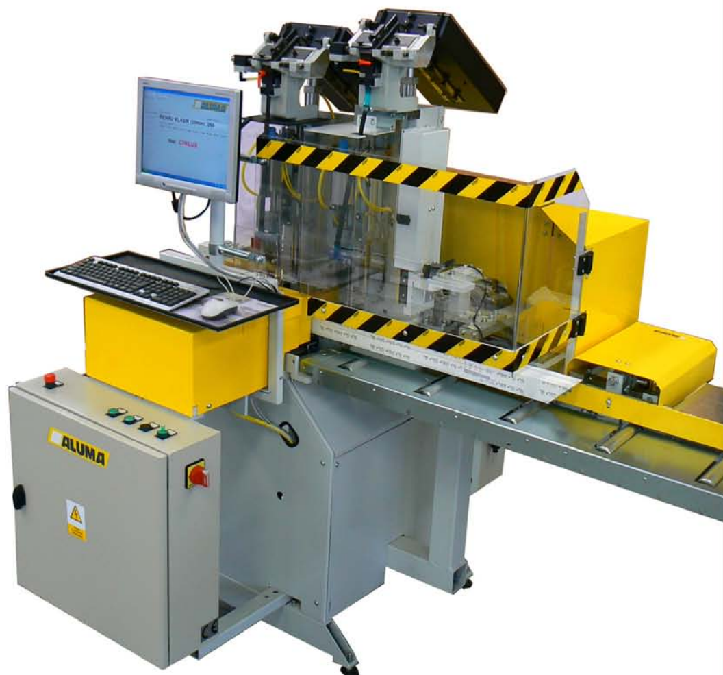
CYKLON D - Dvojhlavý šroubovák ocelových výstuží