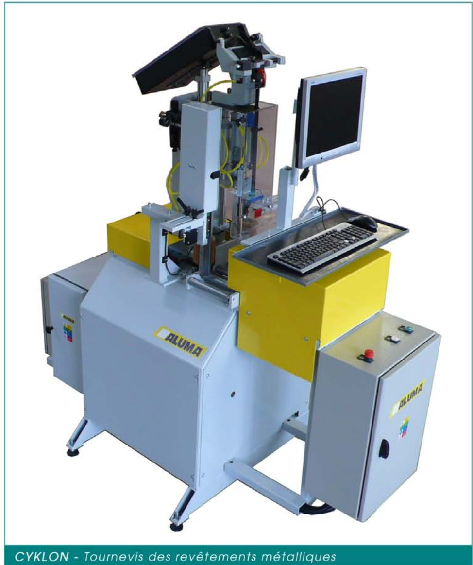
CYKLON - Tournevis des revêtements métalliques