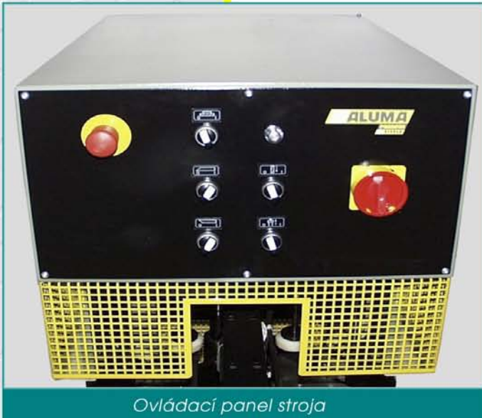
Ovládací panel stroja