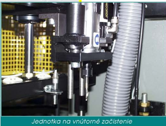
Jednotka na vnútorné začistenie