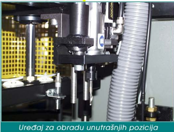
Uređaj za obradu unutrašnjih pozicija