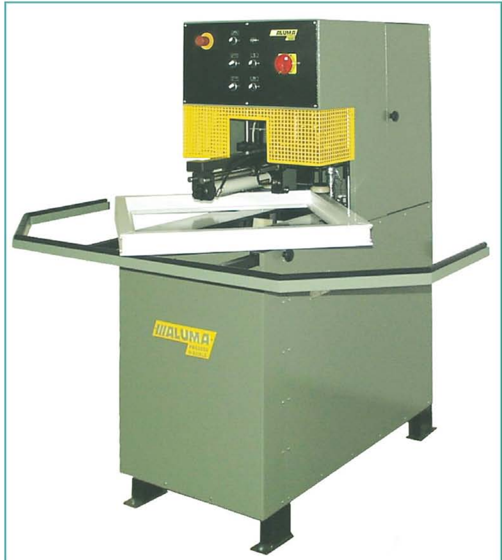
Automat za čišćenje vara RONDO 2000 VJ