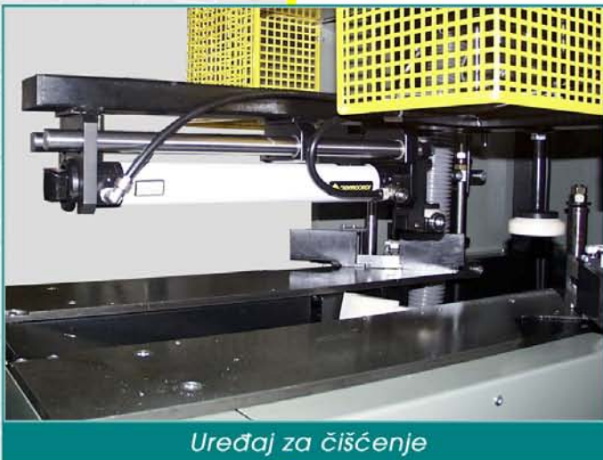
Uređaj za čišćenje