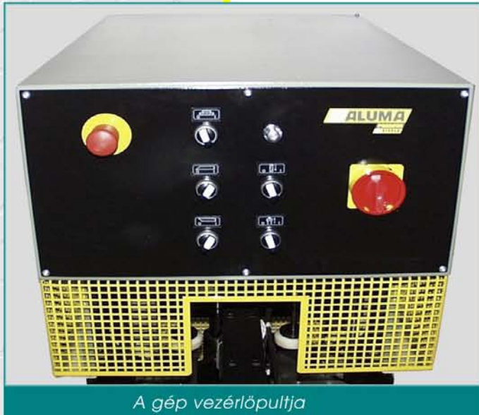
A gép vezérlőpultja