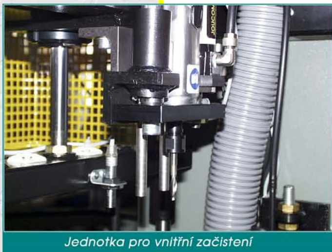
Jednotka pro vnitřní začištění