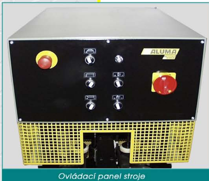
Ovládací panel stroje