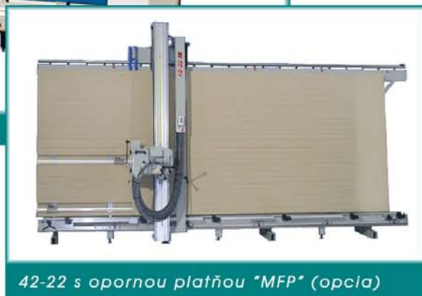
42-22 s opornou platňou "MFP" (opcia)