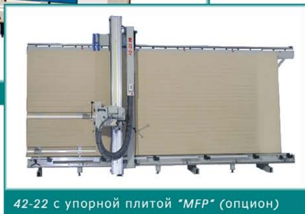
42-22 с упорной плитой "MFP" (опцион)