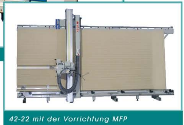
42-22 mit der Vorrichtung MFP